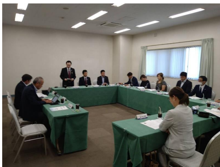
▲クラブ協議会（十和田ロータリークラブ）