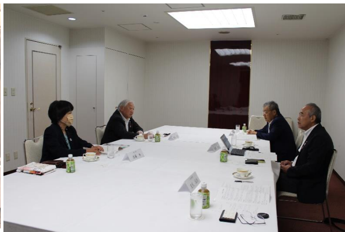
▲会長幹事面談（青森北東ロータリークラブ）