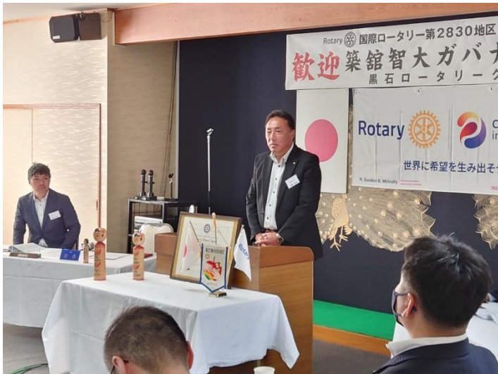
▲工藤会長挨拶（黒石ロータリークラブ）