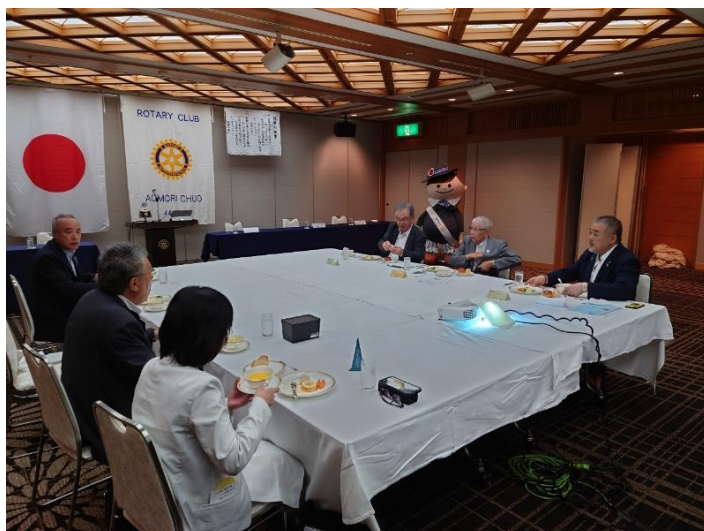
▲例会風景（青森中央ロータリークラブ）