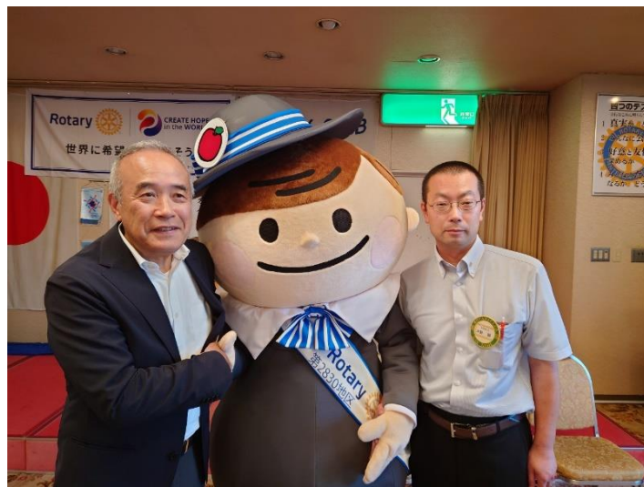
▲大野会長（三戸ロータリークラブ）と 築館ガバナー